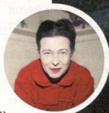
Autorin und Feministin Simone de Beauvoir

Simone de Beauvoir. „Das andere Geschlecht“ ist für mich eines der wichtigsten Bücher dieser Zeit. Revolutionär und die Grundlage für die Frauen- und Geschlechterbewegung.