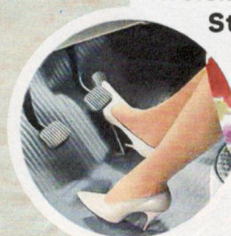
Schick sollten Damenschuhe sein. Bequem waren sie nicht