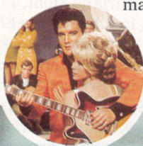
Solo-Star des Jahrzehnts: Elvis Presley

Ich mag alles von Elvis Presley und Louis Armstrong. Zu Rock'n'Roll und Jazz kann man super tanzen, und diese Musikstile geben mir eine Art Freiheitsgefühl.