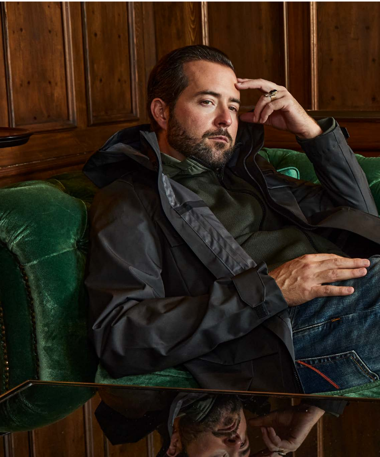
Jacke und Pullover Ecoalf Jeans Jacob Cohen